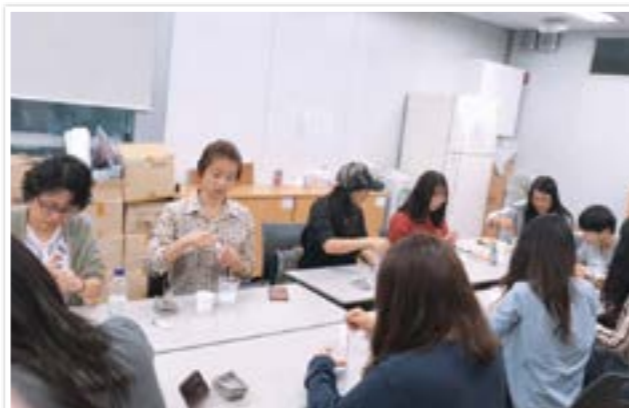
석고방향제 만들어 홀몸어르신택 기부

자원봉사는 하고 싶으나 시간은 내기 어려운 바쁜 현대인이 쉽고 짧게 참여 할 수 있도록 설계된 자원봉사 프로그램. 자원봉사 참여와 시작을 돕는 자원봉사.