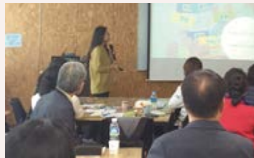
평가와 인정 - 문제해결력과 과정 평가, 사례 공유, 인정과 보상