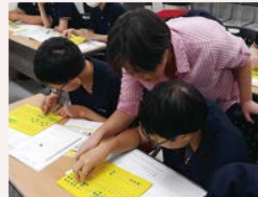
청소년 대상 시각장애인식개선 교육