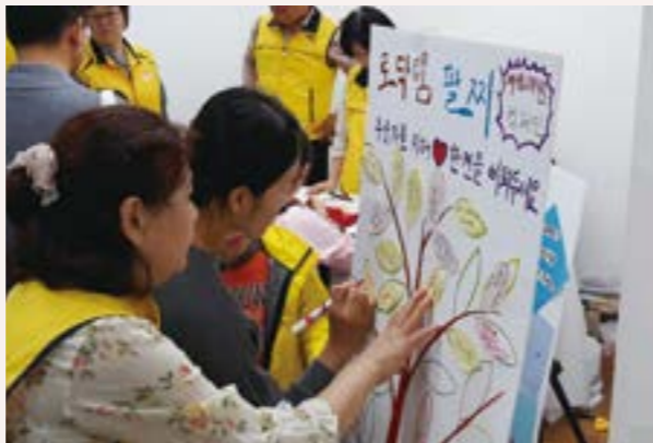
자살예방 캠페인 축제부스 운영