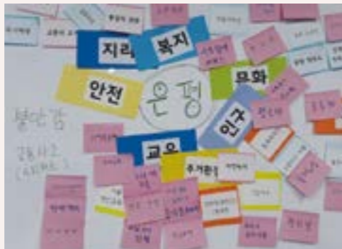
이슈 발굴 - 자료조사/ 문제 해결 과제 선정