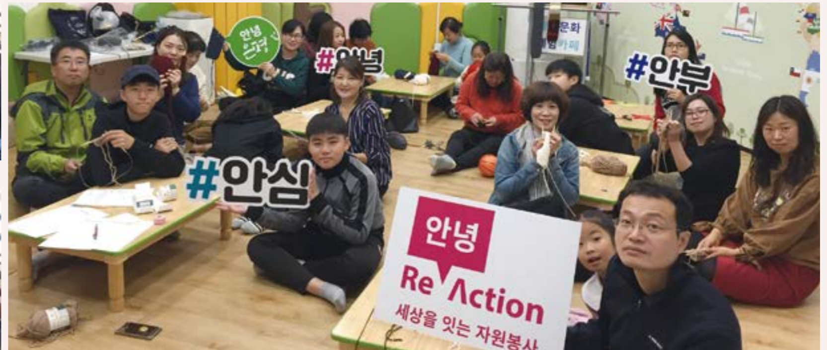
'사랑을 엮는 털목도리' 봉사