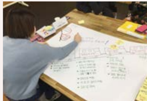
문제 해결 과정 기획 - 목표 설정, 다양한 해결 방식에 대한 논의 - 구체적 해결 과제를 정하고 지역자원과 다양한 해결 방식, 실천 방안을 기획