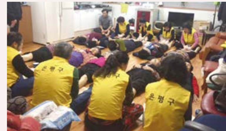
경로당 발마사지 봉사

은평의 모든 시민이 자원봉사자로 함께하는 그날까지 자원봉사 는 1년 365일 지속됩니다. 🟢