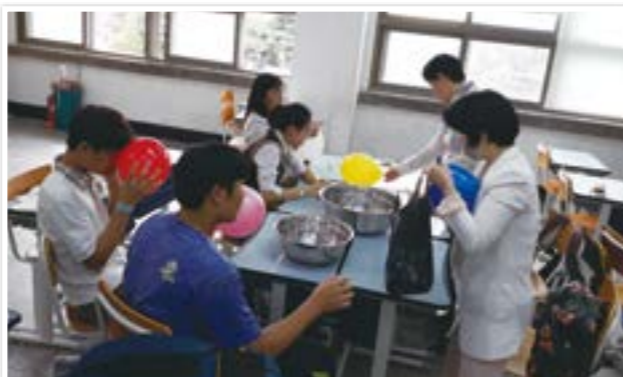
프로젝트 봉사 활동 지원