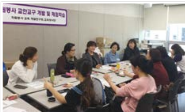
자원봉사 교육 교안교구 개발 회의