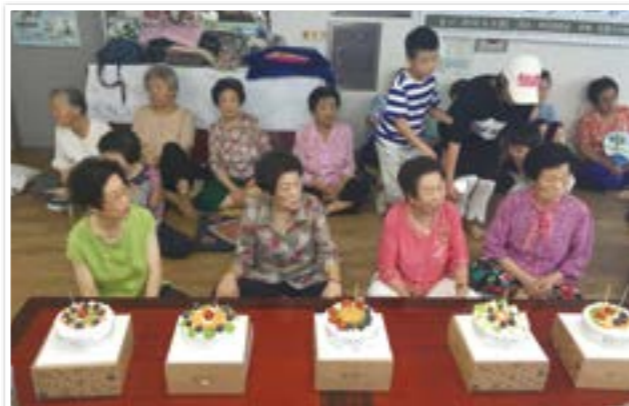
홀몸 어르신 생일 케익 만들어 나누는 핸즈온 가족봉사