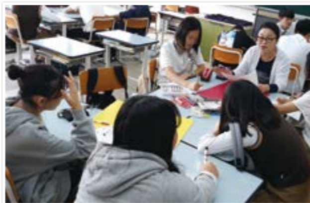
프로젝트 봉사 기획회의

청소년이 학교와 마을에서 자기주도적으로 봉사할 수 있도록 기획 ▶ 실천 ▶ 평가의 전 과정을 알려주고 함께하는 현장의 자 원봉사멘토