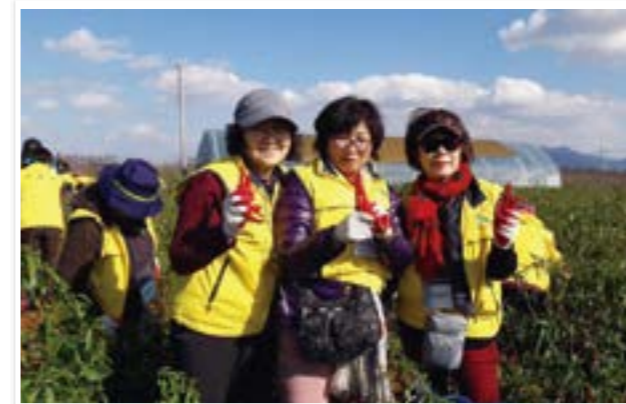
농촌 일손돕기 봉사

여행과 자원봉사가 결합되어 재미를 더하고 여행지에는 도움이 되는 봉사활동