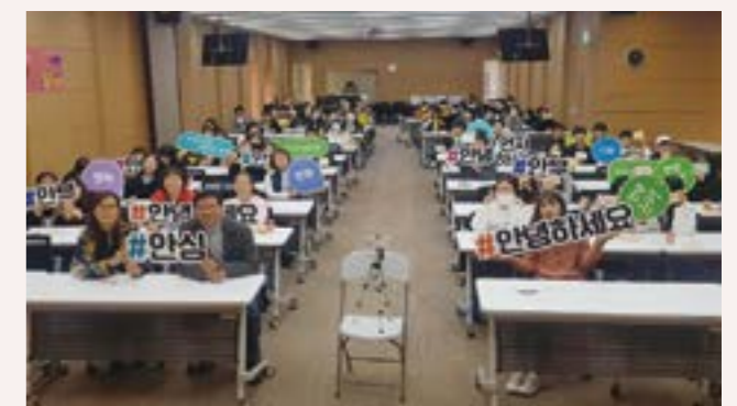
사람책 컨퍼런스 사춘기vs깡년기