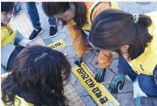
「한박자 쉬고 건너요」스티커 붙이기