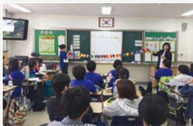
학교방문 자원봉사 교육

청소년, 성인 봉사자를 대상으로 자원봉사 a부터 z까지 현대사회 자원봉사의 역할과 필요성, 자원봉사자의 자세를 알려 주는 교육 봉사단