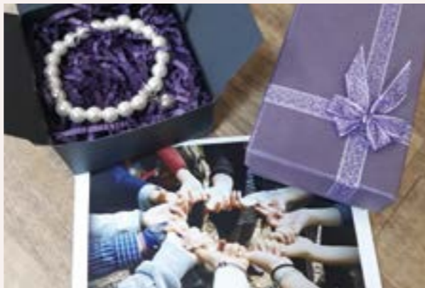
마음이음 팔찌 만들기

8개월간의 긴 호흡으로 진행된 문제해결형 자원봉사 프로젝트는 시각장애인협회은평지회, 은평메디텍고등학교, 음암보건지소, 역촌초 녹색어머니회와 학생회 등 연계 단체와의 지속적인 협의, 봉사자의 열정과 의지로 모든 과정을 거쳐 왔습니다. 프로젝트리더단은 평범한 시민들의 주도적인 자원봉사 참여가 국가 혼자만으로는 풀 수 없는 여러 사회문제를 풀어 나갈 해법이라는 자신감과 확신을 가지게 되었습니다. 긴 시간 한 목표를 향하여 진행된 프로젝트리더단의 시범적인 2018. 문제해결형 프로젝트는 앞으로 더 많은 지역의 변화를 이끌어 낼 것이라 기대합니다. (V)