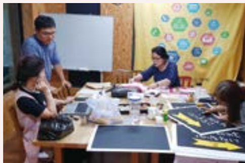
주도적 참여와 실천 - 자원봉사자의 전문성을 살린 자원봉사자의 주도적 실천