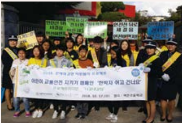
어린이, 녹색엄마와 함께하는 교통안전 캠페인