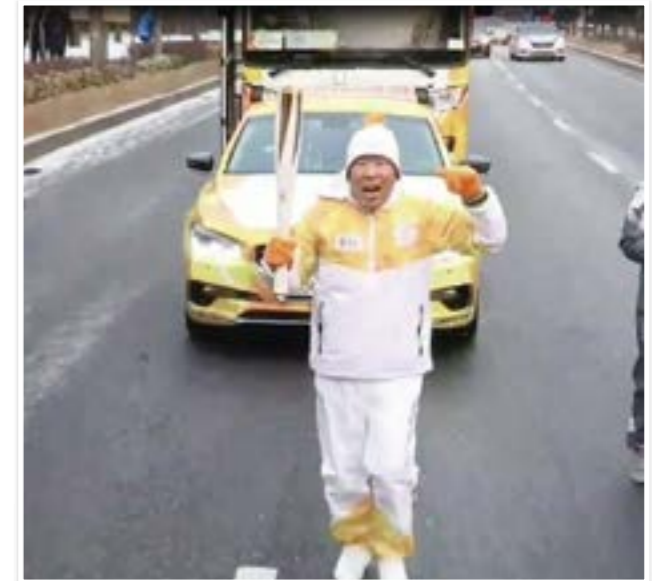
평창올림픽 성공 개최를 위한 성화 봉송 봉사

2018. 평창 동계올림픽의 성공 개최와 운영을 위하여 은평구의 많은 봉사자들이 참여하였습니다.