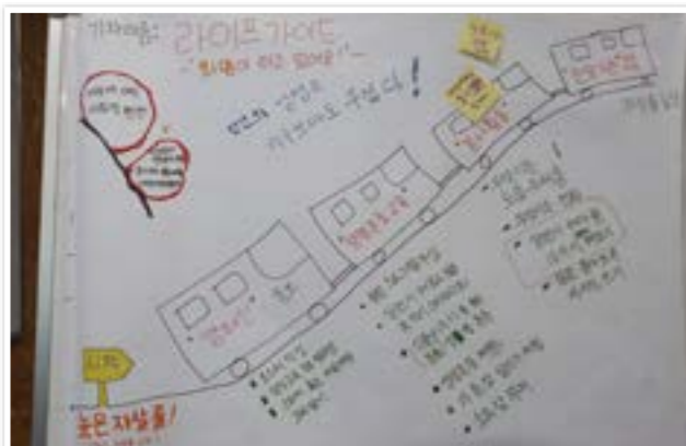
자살예방 프로젝트 기획

은평의 문제를 해부하고 자원봉사로 풀어가는 프로그램을 봉사자들이 직접 설계, 운영하는 봉사단