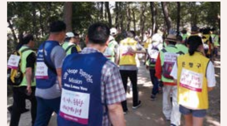
시각장애인과 청소년이 함께 걷는 서오릉 나들이(시각장애인 문화생활지원)