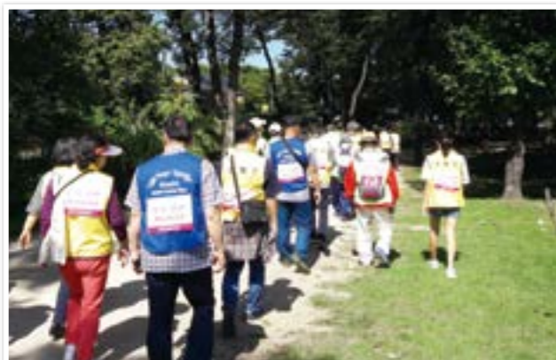
시각장애인인식개선프로젝트 - 문화생활 향유를 통한 삶의 질 높이기 '시각장애인과 함께하는 서오름 나들이'