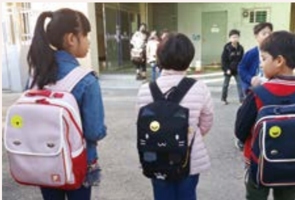
스마일 형광반사 뱃지 나눔