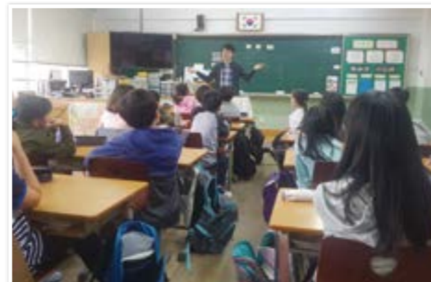
학교방문 사람책 활동

글로 만들어진 책이 아닌 움직이는 책이 되어 청소년들에게 경험을 바탕으로 한 삶의 지혜와 진로설계를 돕는 사람책 봉사단