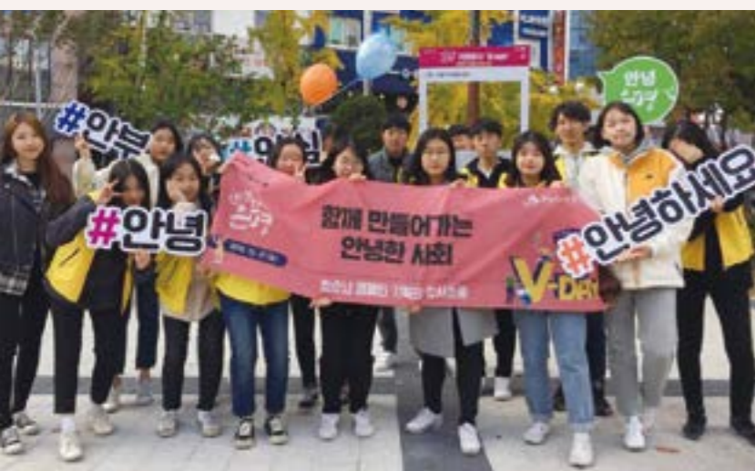
청소년캠페인기획단 청사초롱 '안녕하세요 캠페인'